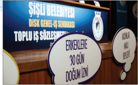
Şişli Belediyesi & DİSK Genel-İş Sendikası İş birliği

Kız çocuklarının eğitime kazandırılması için a) farkındalık kampanyaları, b) veli seminerleri, c) ev ziyaretleri yürüterek ailelere farkındalık çalışmaları, d) okul yaşında olup okula gönderilmeyen kız çocuklarının tespiti ve ilgili makamlara bildirimini, kadınlara ve genç kızlara yönelik meslek edindirme dışında da kişisel gelişime yönelik eğitim programları açmak vb.