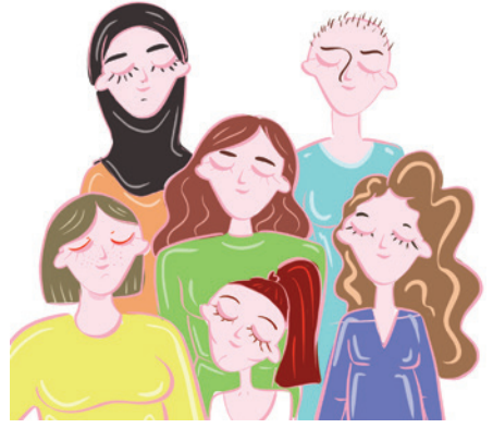
Çizim: Semih Özkarakaş