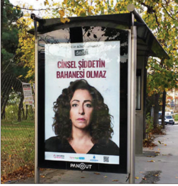
Belediyelerin Cinsel Şiddetle Mücadele Derneği kampanyasına iletişim desteği