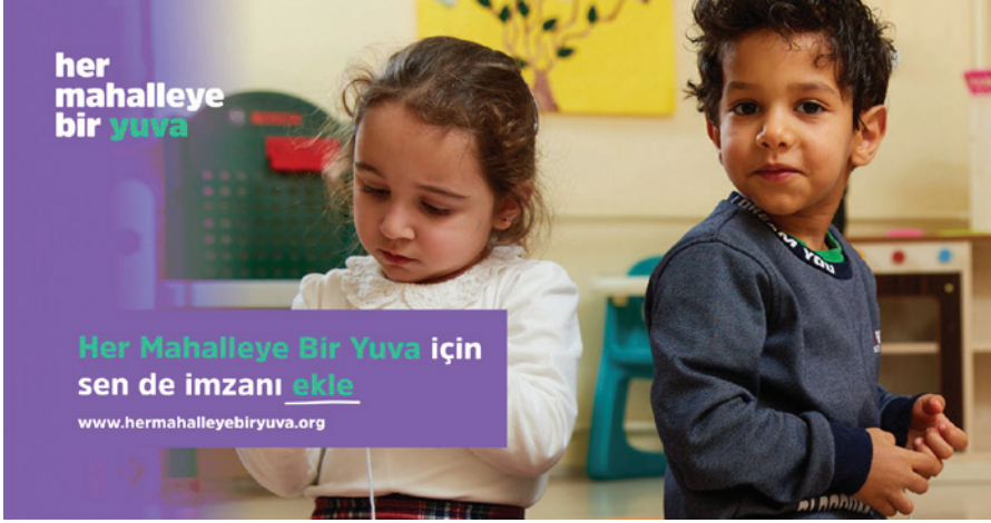
Kadın Emeğini Değerlendirme Vakfı “Her Mahalleye Bir Yuva” Kampanyası

Kadın Emeğini Değerlendirme Vakfı (KEDV) tarafından geliştirilen ve 33 yıldır uygulanan Mahalle Yuvaları modelini yaygınlaştırmak için başlatılan “Her Mahalleye Bir Yuva Kampanyası”, yuvaları o mahallede yaşayan kadınların kurduğu, ortak liderliğe dayalı ve mahallede yaşayan çocuklar için kaliteli okul öncesi eğitim imkânı yaratmayı amaçlayan bir programdır. Bu programda kadınlar birlikte güçlenerek ekonomik ve sosyal hayata katılırken, çocuklar kaliteli okul öncesi eğitim alabilmektedir.