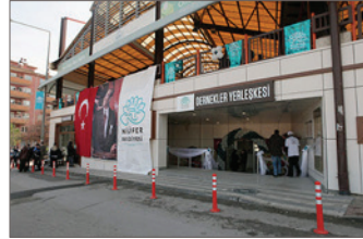
Nilüfer Belediyesi Dernekler Yerleşkesi

Yapacağınız toplantı ve eğitimler için toplantı odası, düzenlemek istediğiniz seminer, panel, konferanslar için konferans salonu, tiyatro, konser, koro gibi çalışmalarınız için konser ve tiyatro salonlarının ve parkların kullanımını belediyelerden talep edebilirsiniz. Tek seferlik alan kullanımları dışında bazı belediyelerin ortak çalışma alanları veya sivil toplum örgütleri için ofis alanı desteği, kooperatifler için üretim atölyesi alanı, tarım alanı tahsisi gibi uygulamaları da mevcuttur.