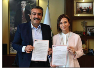
Kadın Adayları Destekleme Derneği "Kadın Dostu Belediyecilik Taahhütnamesi"

Parti ayrımı göstermeksizin büyükşehir, il, ilçe ve belde belediye başkanı adaylarıyla iletişime geçilerek imzalatılan bu taahhütnameyi 70'den fazla belediye başkan adayı imzaladı.