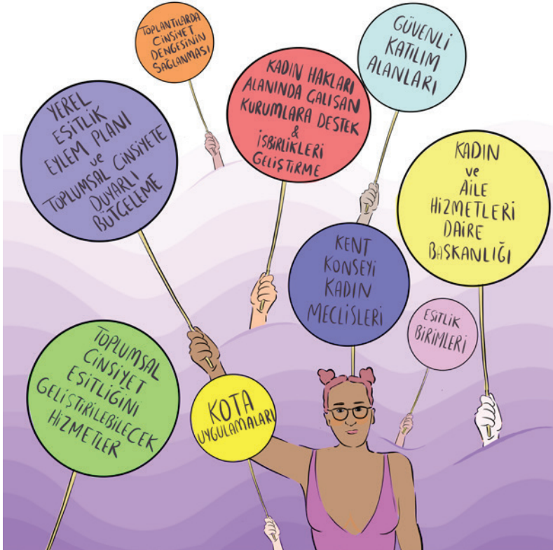
Çizim: Semih Özkarakaş

İlk olarak, her ne kadar eskidiği gibi bir izlenim yaratılsa da yerel seçimlerde gençlik kotaları çok önemli bir uygulamadır. Türkiye'deki tüm belediye meclislerinde kadın meclis üyesi oranı %10,7'ye yakın belediye başkanı oranı %3,2'de kalıyor. Bu oran hem TBMM'deki kadın temsil oranından düşük hem de Avrupa yerel yönetimlerdeki kadın temsili sıralamasında en alt sırada. Öte yandan, yerel yönetimlerde danışman, genel sekreter, daire başkanı ve diğer karar alıcı ya da uygulayıcı pozisyonlardaki kadınların oranı hakkında net bir bilgi sahibi değiliz. Bütün bu yerel yönetim pozisyonlarında kadınların adil şekilde temsil edilmesi için kota uygulamalarının hayata geçirilmesi,