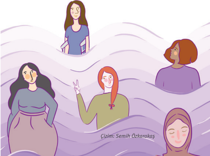
Çizim: Semih Özkarakaş

Türkiye'de kadınların %62,5'inin (erkeklerin ise %5,4'ünün) herhangi bir kişisel geliri bulunmamakta. Bu nedenle cebinden para çıkmasına gerek kalmadan ulaşabileceği hizmetler kadınlar için büyük önem taşıyor. Eğitim Reformu Girişimi'nin son raporuna göre Liseye Geçiş Sınavı (LGS) 2020 kapsamında yapılan merkezi sınav sonuçlarında, ilkökul mezunu annesi olan öğrencilerle lisansüstü mezunu annesi olanlar arasında 120,5 puanlık bir fark var. OECD, kadın ve erkeklerin işgücüne katılım oranlarının birbirine yaklaşması durumunda, 2030 yılı itibarıyla Türkiye'nin de dahil olduğu tüm OECD ülkelerinin toplam ekonomilerinde %12'lik potansiyel bir artış sağlanacağını öngörmekte. Bu nedenle yerelde kadınlara yönelik yapılan her yatırımı aslında Türkiye ekonomisine ve geleceğimize yapılan bir yatırım olarak da okumak gerekiyor ve belediyelerin bu alanda yapabileceği çok şey var.