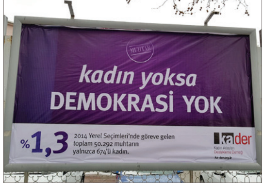
Belediyelerin Kadın Adayları Destekleme Derneği kampanyasına iletişim desteği